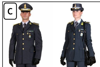
LA GUARDIA DI FINANZA