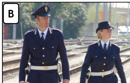
LA POLIZIA DI STATO