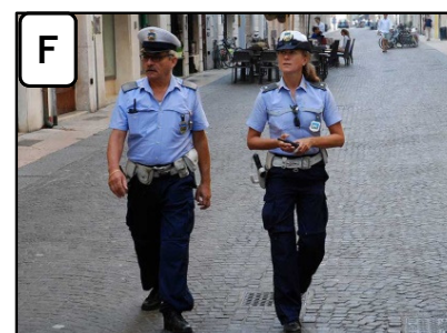
LA POLIZIA MUNICIPALE