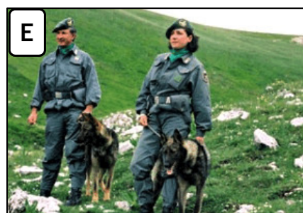
LA GUARDIA FORESTALE