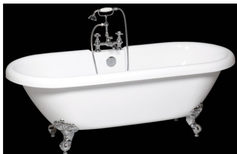
LA VASCA DA BAGNO