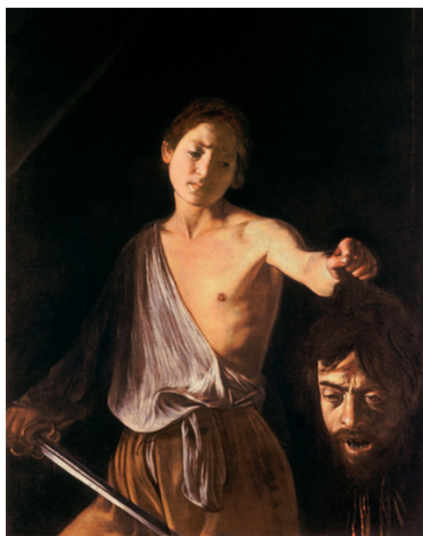
Caravaggio, Davide con la testa di Golia, 1610, Roma (Lazio), Galleria Borghese.