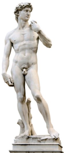
Michelangelo Buonarroti, David, 1501/1504, Firenze (Toscana), Galleria dell'Accademia.

Quando ti senti pronto, registra con lo smartphone la tua lettura. Infine riascolta la tua lettura e confrontala con quella della traccia 17_esercizi_fonetica-02.mp3.