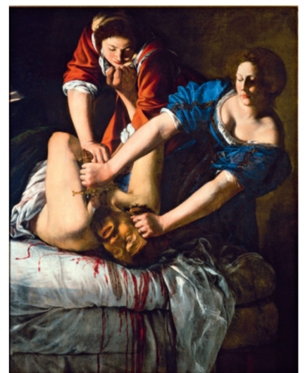
Artemisia Gentileschi, Autoritratto come allegoria della Pittura, 1638/1639, Windsor (Gran Bretagna), Royal Collection.